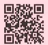
公共施設予約システム

≪予約可能期間≫ 公共性の高い事業または大規模事業は6月前から、それ以外は2月前から予約できます。