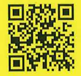
公共施設予約システム

＜予約可能期間＞ 公共性の高い事業または大規模事業は6月前から、それ以外は2月前から予約できます。