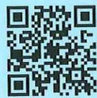
公共施設予約システム

《予約可能期間》 公共性の高い事業または大規模事業は6月前から、それ以外は2月前から予約できます。